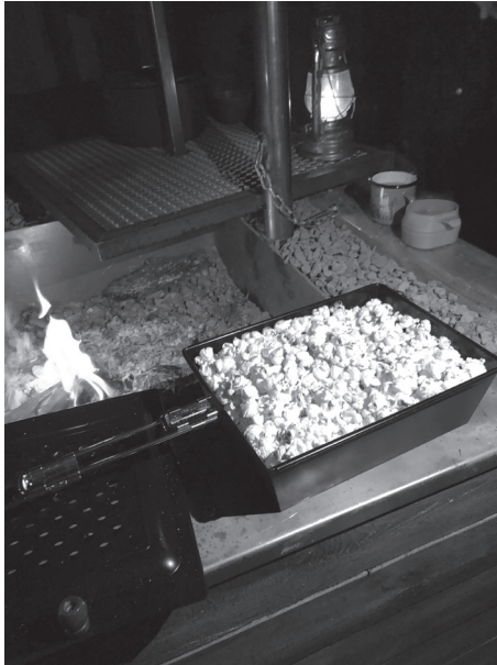
Ledarna har under hösten en egen hajk och passade då på att lyxa till det med popcorn!

Äventyrarna (12 -15 år) började höstterminen utomhus och har haft makramé och lagat trerätters utomhus. Efter höstlovet blev det några veckors uppehåll, innan vi började ses, då digitalt. Vi har spelat spel, löst mysterier och gjort pepparkakshus. Vårterminen startade digitalt, men nu träffas vi utomhus igen. Vi har åkt pulka, spelat multiboll i snön och pratat eld. Scouternas största längtan just nu är att få genomföra ett helt vanligt läger i sommar.