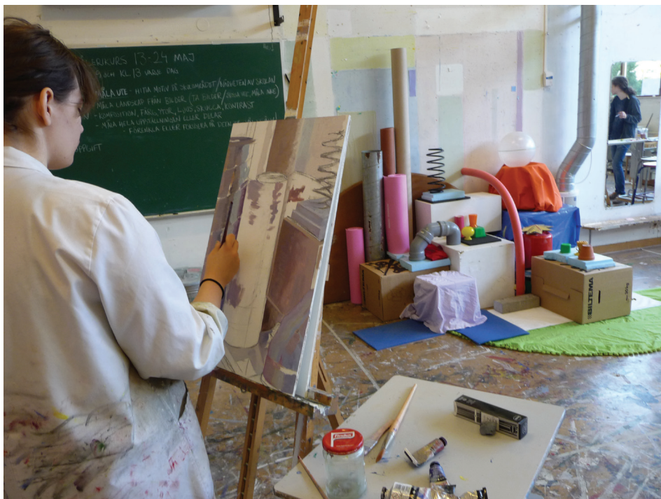
Elever på konstlinjen på Lunnevals folkhögskola ställer ut i Galleri Magnifik från 19 april till 16 maj.