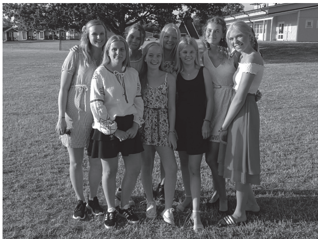
Så här roligt hade gänget från Missionskyrkan i Linköping senast Groowe genomfördes sommaren 2019. Se till att boka 3-8 augusti 2021 och följ med!