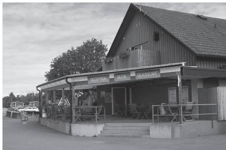
Equmeniakyrkans sommargård på Öland, Klintagården, förbereder sommaren med förhoppning om att kunna ta emot gäster och genomföra arrangemang.